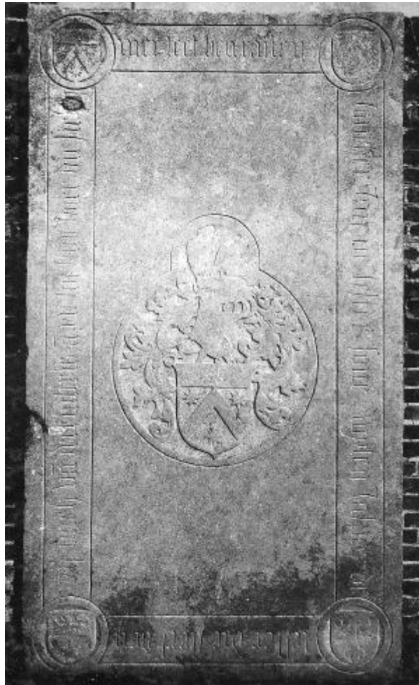
Grafsteen joncker Jan de Lester.