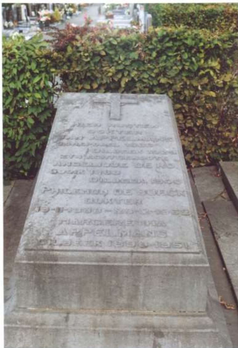
Zijn grafsteen bevindt zich op de gemeentelijke begraafplaats van Dilbeek.